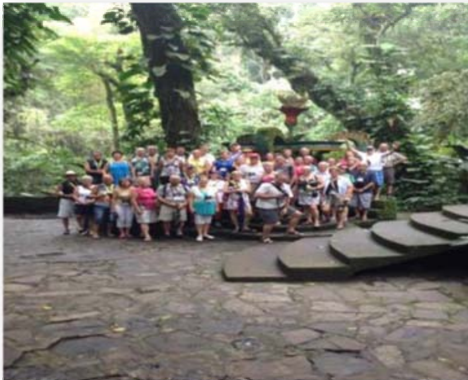
Photo du groupe Caravanes Soleil à Xilitlà

Il mourut en 1984 et maintenant une fondation s'occupe de la conservation de ce lieu précieux pour les habitants de ce village.