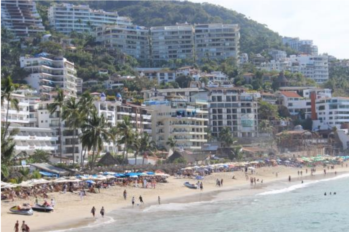
La magnifique vue de la ville de Puerto Vallarta

Bientôt, cela sera la réalité... de retour au Québec