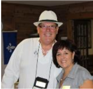
Chefs de caravane Équipage 1