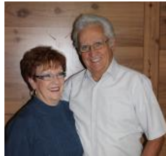
Serre-files Équipage 2