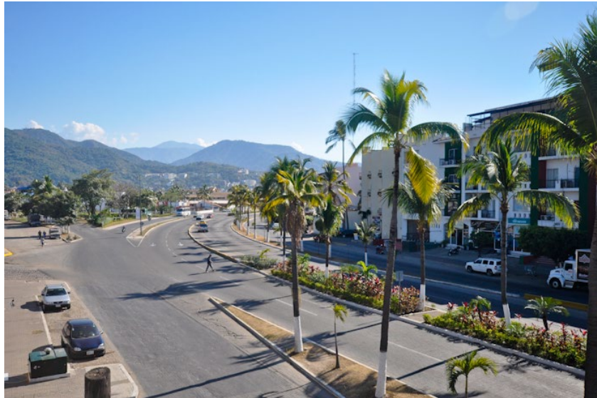
Avenida Medina Ascencio, le boulevard central de Puerto Vallarta

Est-il préférable d'apporter notre voiture au Mexique? La réponse est : oui et non . Si vous venez avec nous en novembre, vous arriverez en décembre à Puerto Vallarta et vous y séjournerez donc environ 3 mois. Vous seriez donc beaucoup plus autonomes si vous aviez votre propre voiture pour circuler où bon vous semble pendant tout ce temps, sinon vous devrez prendre l'autobus ou les taxis, quoique pas tellement dispendieux. Avoir sa propre voiture vous permettra de vous rendre aux diverses plages de la région ainsi que de visiter aussi les différentes villes et villages dans un rayon de 80 kilomètres au Nord et au Sud de Puerto Vallarta. Plusieurs n'en remorquent pas tandis que pour d'autres, il n'est pas question de voyager sans leur voiture. Si vous venez avec nous en janvier, le problème d'autonomie se posera moins car vous ne séjournerez que 4 ou 5 semaines à Puerto Vallarta. C'est donc à vous de voir ce qui vous convient le mieux, d'accord?