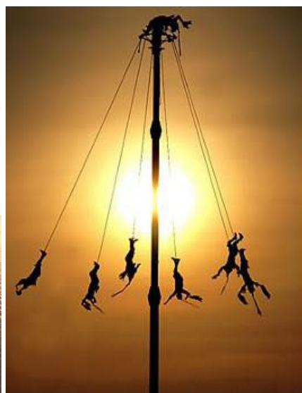
Puerto Vallarta : une ville tout simplement magnifique en bord de mer!