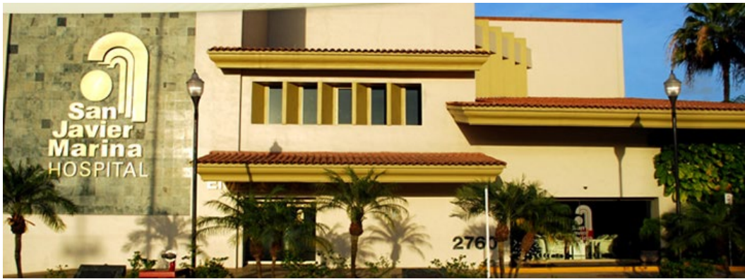
L'Hôpital San Javier Marina située à moins de 10 minutes à pied du camping!